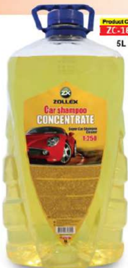
Product Code: ZC-161 5L