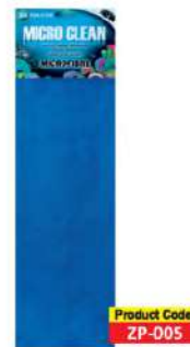
Серветка мікрофібра синя