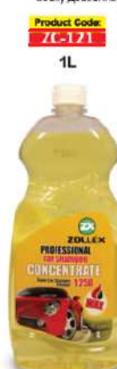
Product Code: ZC-121 1L