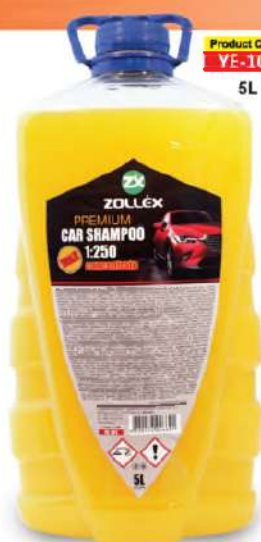
Product Code: YE-101 5L