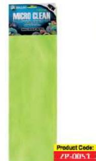
Серветка мікрофібра салатова професійна