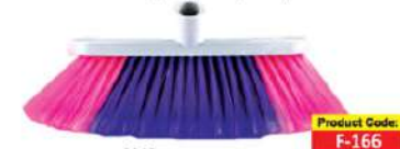
Щітка для мийки ковдр (м'яка)