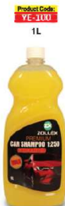
Product Code: YE-100 1L