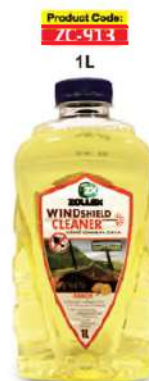
Product Code: ZC-913 1L