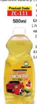
Product Code: ZC-111 500ml

Концентрат шампуню для ручного миття "Professional" - це ефективний мильний засіб з додаванням воску. Шампунь якісно видаляє бруд і маслянисті відкладення з поверхні будь-яких лакофарбових покриттів автомобіля, не залишаючи при цьому слідів і розводів. Додавання воску дозволяє тривалий час захищати лакофарбове покриття від ультрафіолетових променів і притягання частинок пилу, при цьому залишаючи блискучий шар основного захисту.