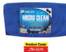
Серветка мікрофібра синя