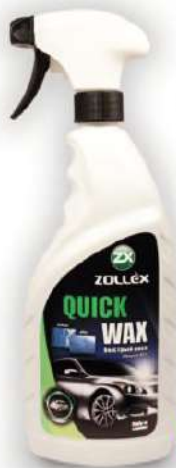
Product Code: SF-033 750ml

Спосіб застосування: Вимийте автомобіль за допомогою автошампуню. Струсніть баночку перед використанням. Нанесіть швидкий віск за допомогою тригера на вологу поверхню автомобіля і наспірюйте насухо за допомогою м'якої серветки. Дотримуйтеся правил, за один захід обробляючи по одній деталі.