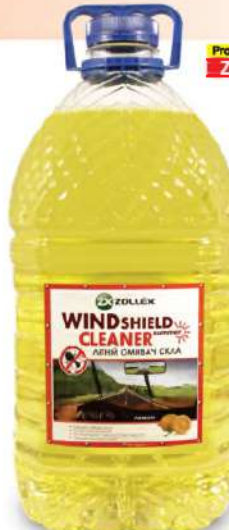
Product Code: ZC-953 5L