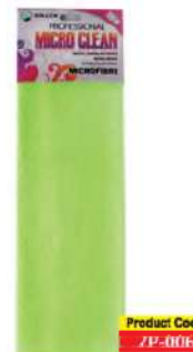
Серветка мікрофібра салатова