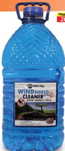
Product Code: ZC-905 5L