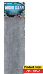
Серветка мікрофібра сіра