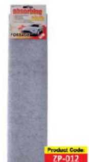
Серветка вологопоглинаюча сіра