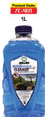
Product Code: ZC-901 1L