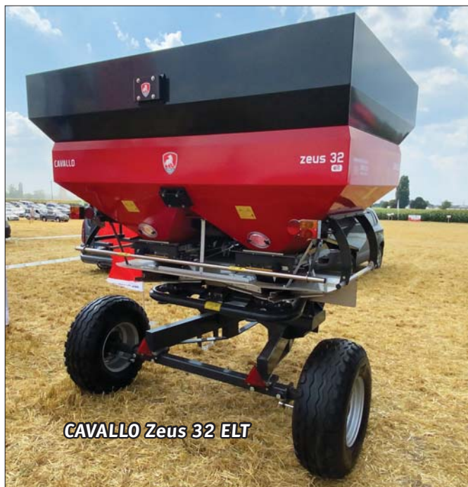
CAVALLO Zeus 32 ELT

Цікаво, що саме висипання гранул відбувається не по центру машини, як у більшості конструкцій розкидачів мінеральних добрив, а з боків. Це додатково дозволяє утримувати стабільну норму внесення, запобігати похибкам. Це справді геніально проста система, ко-