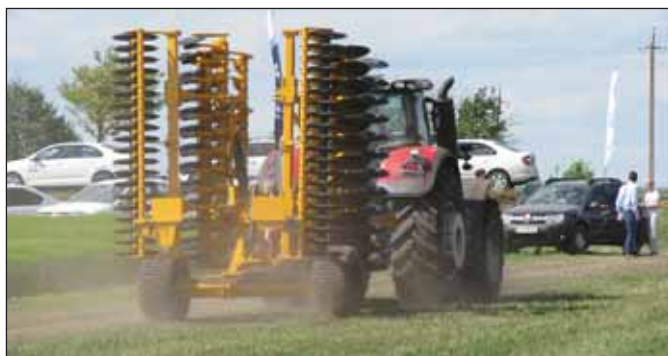
Ширина шестиметрового агрегату в транспортному положенні – 3 м, рама складається з двох частин.