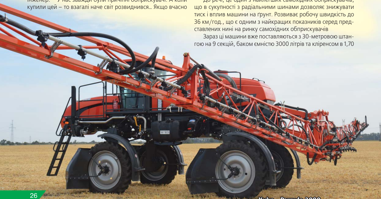
Kuhn - Parruda 3000

Зараз ці машини вже поставляються з 30-метровою штангою на 9 секцій, баком ємністю 3000 літрів та кліренсом в 1,70